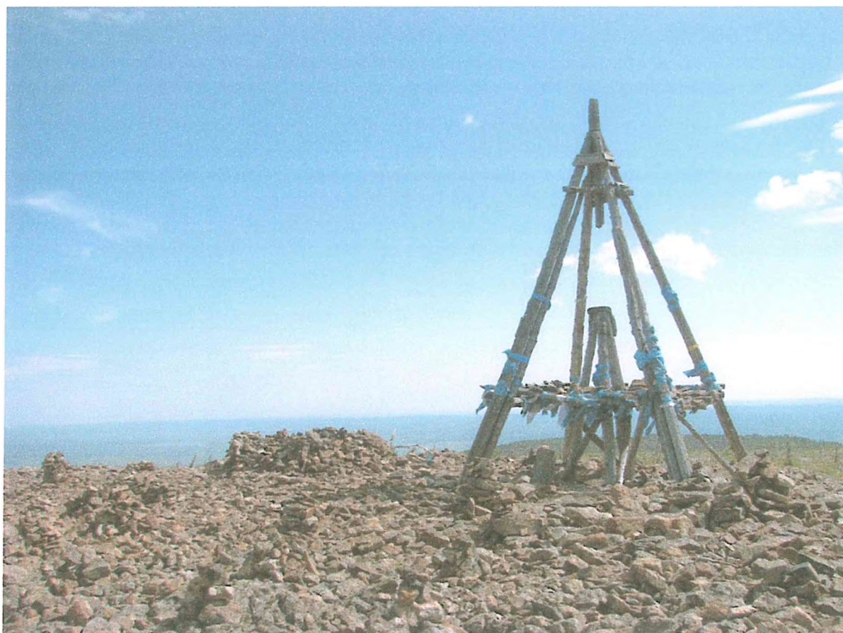
Фотография 1 Триангуляционный знак на туристском маршруте «Вершина»