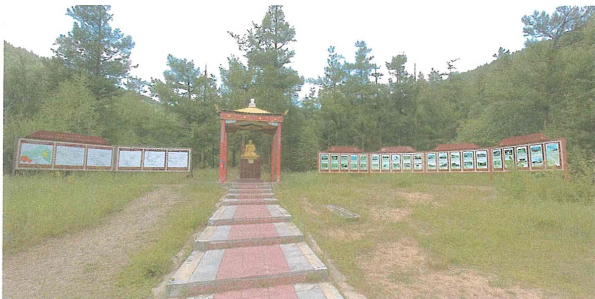
Фотография 2 Статуя Будды медицины и информационные щиты на туристском маршруте «Вершина»