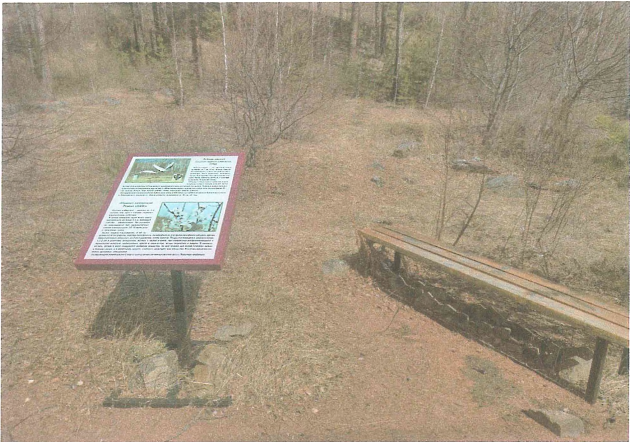
Фотография 4- информационные щиты на туристском маршруте «Вершина»