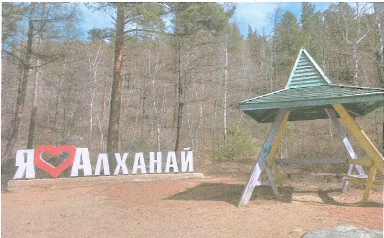
Фотография 5 Арт-объект «Я люблю Алханай» и место отдыха на туристском маршруте «Вершина»