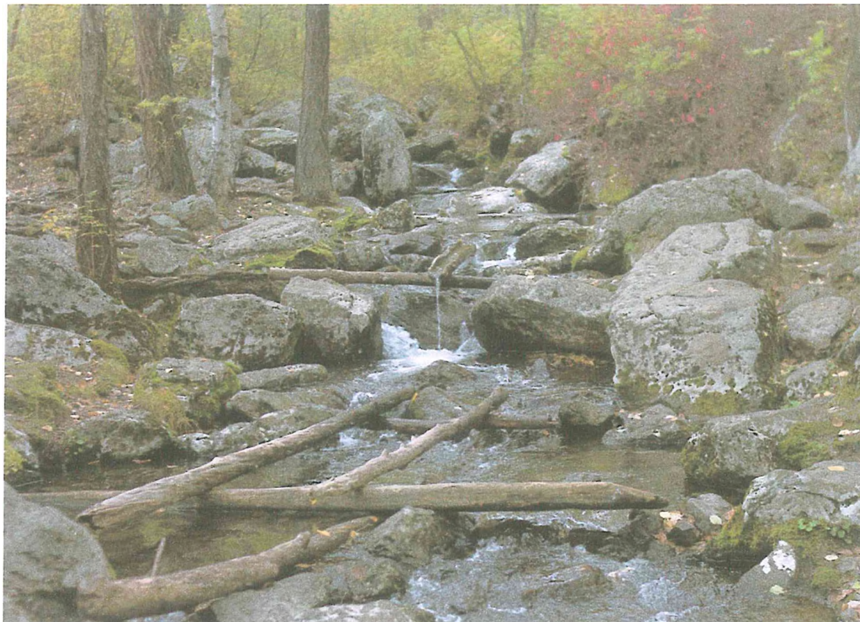
Фотография 3 Аршан на туристском маршруте «Вершина»